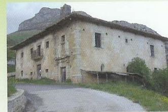
Palacio de Bores