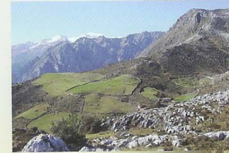
Majada de Tremañu - Cuñaba